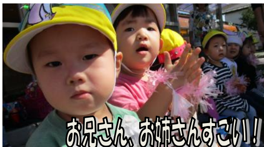
お兄さん お姉さんすこい!