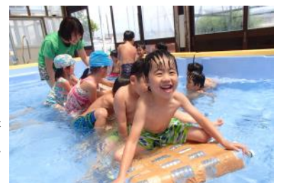
ペットボトルの船

★少人数での活動でしたので、普段のクラスの活動より落ち着いて生活できたようです。とても暑い夏休みでしたが、言葉の数や感情の表現も増えて家族での会話も楽しくなりました。