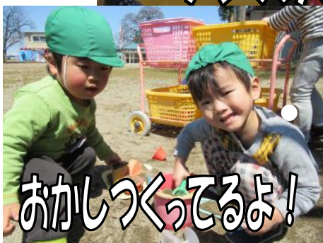
おかしつくってるよ！