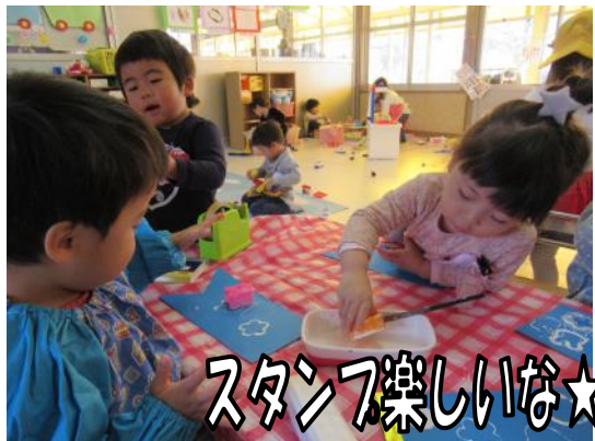
スタンプ楽しいな☆

進級・入園から1ヵ月が経ち、友達や保育者に慣れ、楽しく過ごしています。天気の良い日には「今日外にいけるかな～」と楽しみにしているお子さんたちです。