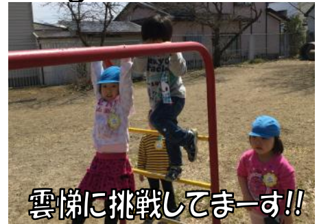
雲梯に挑戦してまーす!!