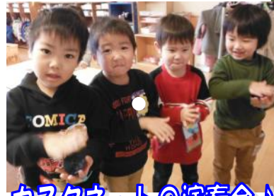
カスタネットの演奏会!