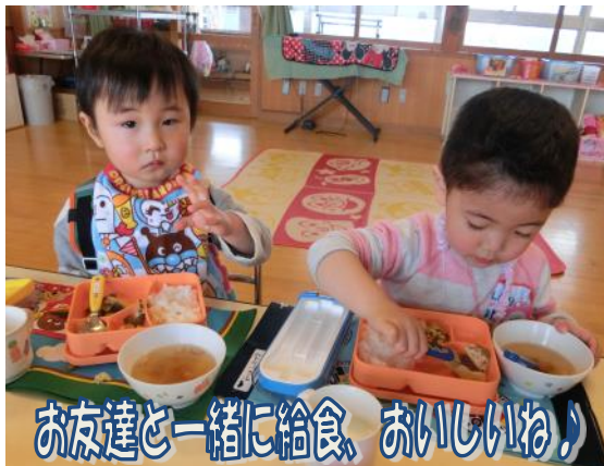
お友達と一緒に給食、おいしいね！

好きな遊びの時間には、おままごと・粘土・お絵描き・パズル・ブロックなどから自分でしたいことを選んで遊んでいます。特にままごとでは「はいどうぞ」「お買い物行ってきまーす！」などと友達や保育者とのやりとりを楽しんでいます。