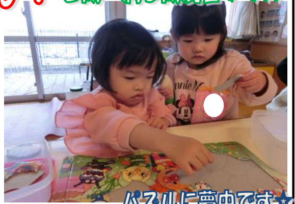
パズルに夢中です★

登園後は保育者と一緒に、所持品の始末を行い、トイレへ行きます。「ノートはここ？」「コップ出すね」と次に何をするかを覚えてきました。始末を終えらるとお友達と一緒にトイレへ向かうい便座に座り、排泄のタイミングが合うと「出たよー！」と保育者たちに嬉しそうに報告しています。また、「自分でやる！」とズボンの着脱等も頑張っているお子さん達です。